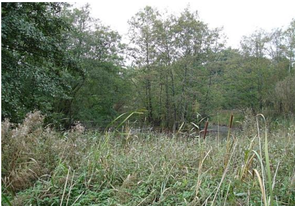
Fra Gyngemosen Nord