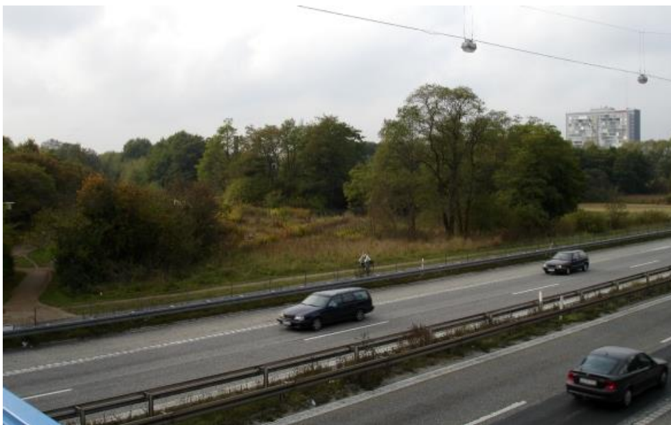
Hillerød motorvejen er en betydelig barriere mellem Gyngemosen nord og syd

Rørunderføringer under Hillerød motorvejen omtales senere i rapporten. Det vil være ønskeligt at disse udformes, så faunaen kan passere i tørre perioder!