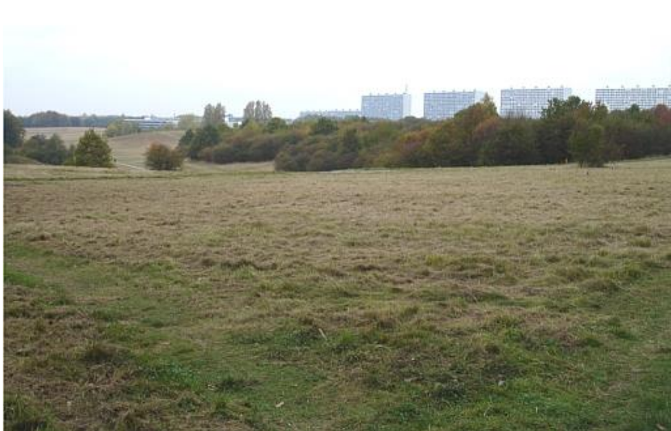
Det vil være en berigelse af området med afgræsning ved kvæg

Nærheden til både Tingbjerg-bebyggelsen (med dertil hørende velkendt høj hærværksbelastning af omgivelserne) og Hillerød Motorvejen kan give anledning til overvejelser. Delområde C ligger med større afstand til såvel Tingbjergbebyggelsen og Hillerød motorvejen, hvilket kan tale for at vælge den placering i stedet. Af sikkerhedsmæssige grunde må der alligevel kraftigt overvejes en form for overvågning.