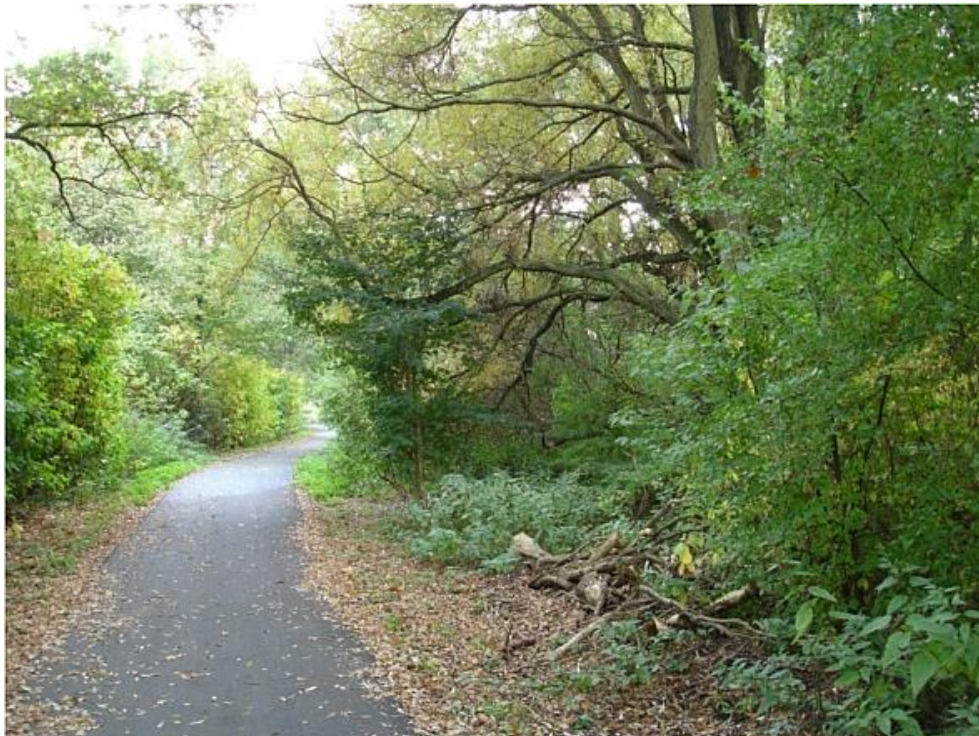
Gyngemosestien mod Hillerød motorvejen (Rart at se ved, der får lov til at ligge, som levested for mange organismer).