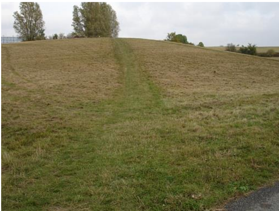
Et oplagt sted at skilte om Bøgebjerghullet/Kratersøen på toppen af bakken.

Lokale naturgrupper har en indsigt i såvel natur som formidling. Derfor kan det med fordel af planen fremgå, at kommunens information vil blive udformet i samarbejde med en eller flere grønne organisationer, naturgrupper med videre.