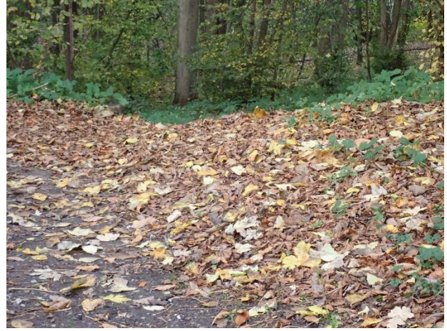
Alternativet til trappen er en tur over kanten...