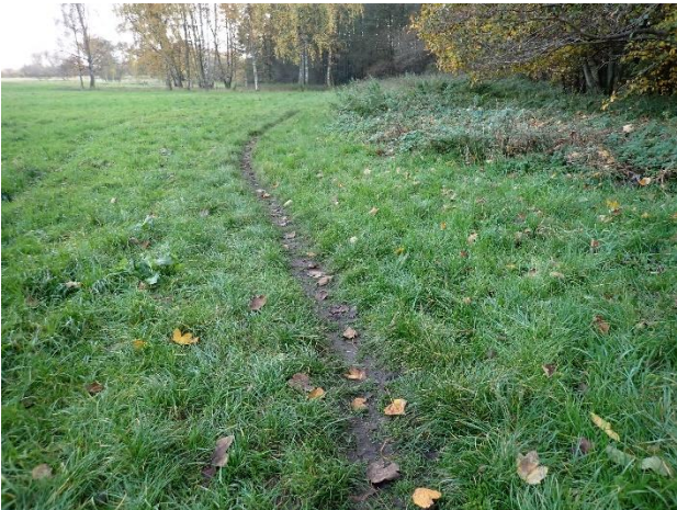
(Heller) ikke farbart for kørestole el.lign.